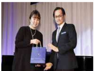
↑ GALA KANSAI 2017 ガラ・パーティー関西 2017の様様