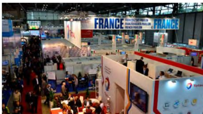
Francouzský pavilon na MSV 2019

Vysoce výkonná těsnění společnosti Technetics se používají v kritických oblastech jako je jaderný průmysl a oil & gas nebo ve vesmírných programech. V letadlových lodích několika meceností se používají teleskopické kulčkové listy firmy Chambrelan, které unesou až 1,5 tuny. Vývoj a výrobu CNC strojů pro ohýbání drátů a trubek na zakázku nabízí Numalliance, která jeden vzorový stroj přivezla také do Brna. Dráty a výroba pružin jsou také předmetem zájmu firmy Lachant Spring CZ, která má výrobu na okraji Prahy.