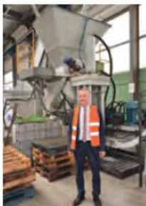
Technologie snižuje dopad výroby na životní prostředí.

Celý systém je navíc pod kontrolou i na dálku a jeho operátor dostává informace o stavu a vytížení stroje přímo přes SMS nebo email do svého telefonu. Při zpracování třísek tak nezvznikají prodávky, linka