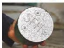
Briketa z ocelových pilin.

Obě firmy se společně účastní Mezinárodního strojirenského veletrhu, kde s podporou Francouzsko-české obchodní komory vystavují v rámci Francouzského pavilonu. Celou technologii, včetně briketovačky, si můžete prohlédnout na stánku P 135 v pavilonu P. US