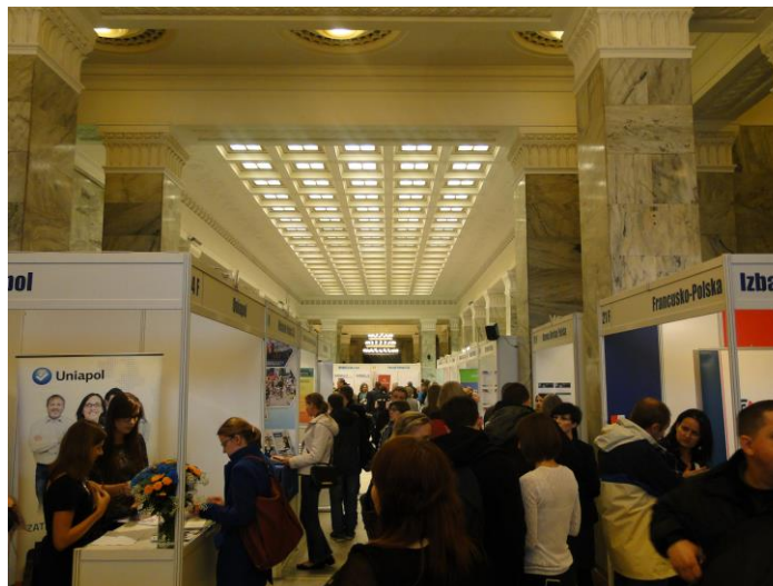
Przestrzeń wystawowa Strefy Francuskich Pracodawców.