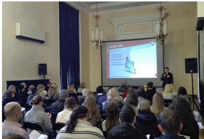
Prelekcja partnera TPiP na temat przygotowania CV.