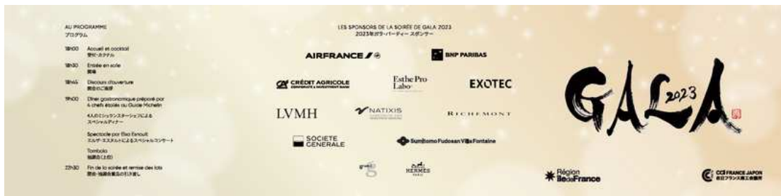
招待状 Invitation card