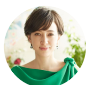
滝川クリステル様 TAKIGAWA Christel