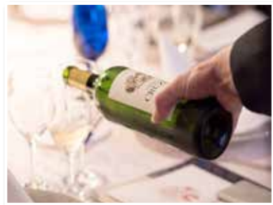
↑ GALA FUKUOKA 2018 ガラ・パーティー福岡2018の様