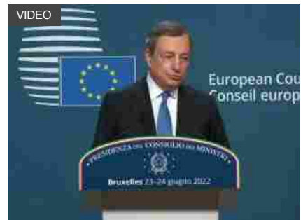
Ue, Draghi: no a price cap gas per paura taglio forniture russe

Ritaglio stampa ad uso esclusivo del destinatario, non riproducibile.