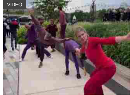
Cuori che battono all'unisono: nel mondo di Marinella Senatore