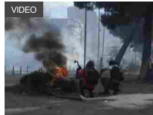
Ecuador, 11 giorni di scontri e manifestazioni contro il carovita