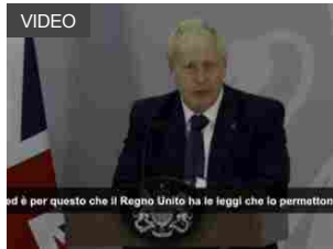
Boris Johnson: Corte Usa su aborto un grande passo indietro