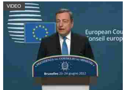
Draghi: la dipendenza dal gas russo è scesa dal 40% al 25%