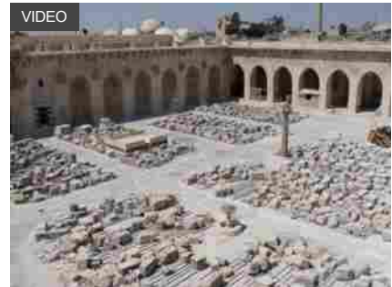
Dopo la guerra: a Aleppo il restauro della moschea degli Omayyadi