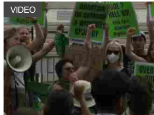
La Corte Suprema Usa cancella il diritto federale all'aborto