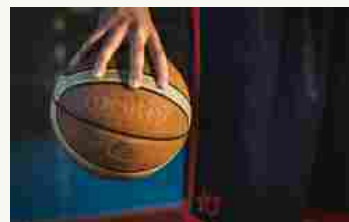
Pallacanestro Cantù cambia allenatore