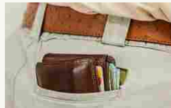
Rovello Porro il furbetto del reddito di cittadinanza