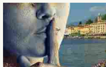
Ritorna il festival di Bellagio e del lago di Como