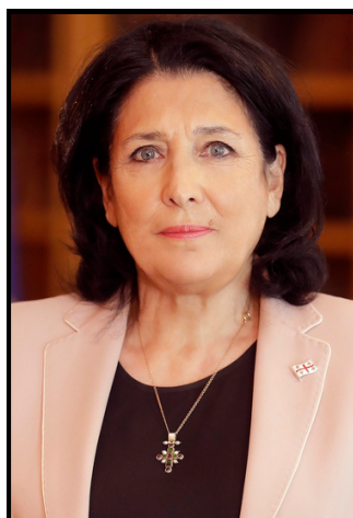
Salomé Zourabichvili Chef d'État

Avant l'adoption de ce drapeau, la Géorgie a eu plusieurs autres drapeaux au cours de son histoire, le plus ancien datant de l'époque médiévale.