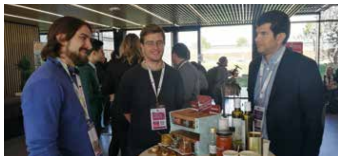
Los representantes de las empresas españolas Wise Nature y Aceite La Casona dando a conocer sus productos.

Del conjunto de empresas acompañadas por nuestra entidad, se pueden destacar dos de ellas. La empresa valenciana Wise Nature, que dio a conocer el carácter innovador de sus preparaciones con superalimentos, demostrando ser creativas, sabrosas y saludables. Además, fue una buena ocasión para aprovechar los intercambios con actores del sector, para entender mejor las posibilidades y los límites del mercado.