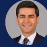
Av. Fatih Işık Işık & Partners Law Firm