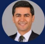
Av. Fatih Işık Işık & Partners Law Firm