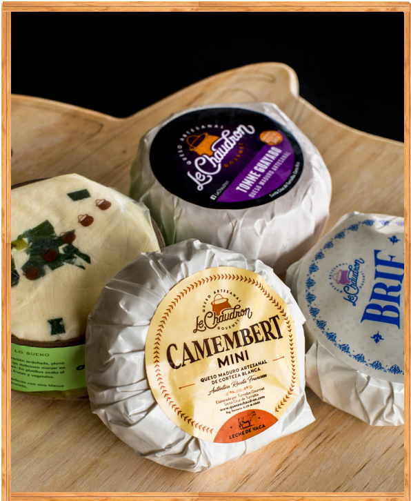
TABLA CHAUDRON GRANDE