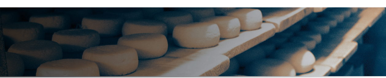
TABLA CHAUDRON MEDIANA