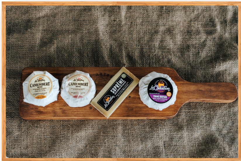
TABLA MINI BOCADILLOS MADUROS