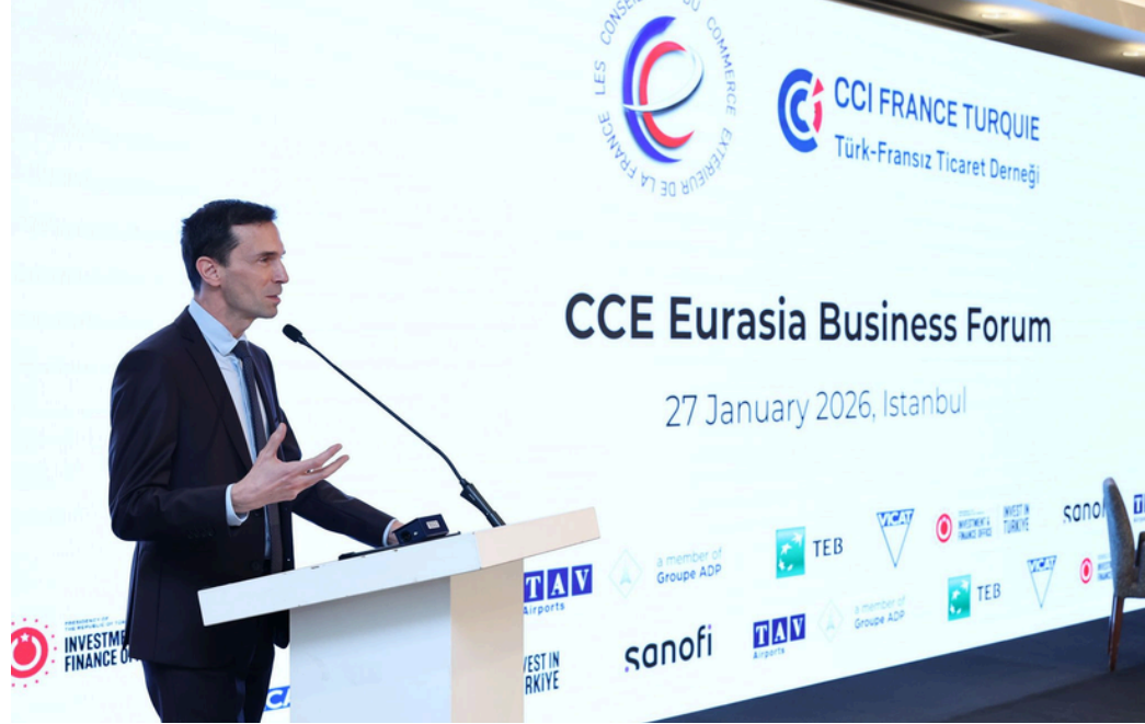
27.01.2026 / CCE Business Forum, Swissôtel The Bosphorus Istanbul