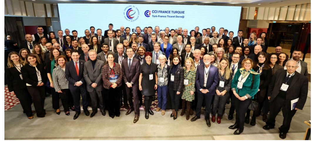
27.01.2026 / CCE Business Forum, Swissôtel The Bosphorus Istanbul