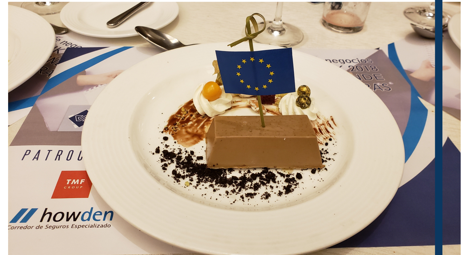
Almuerzo de integración