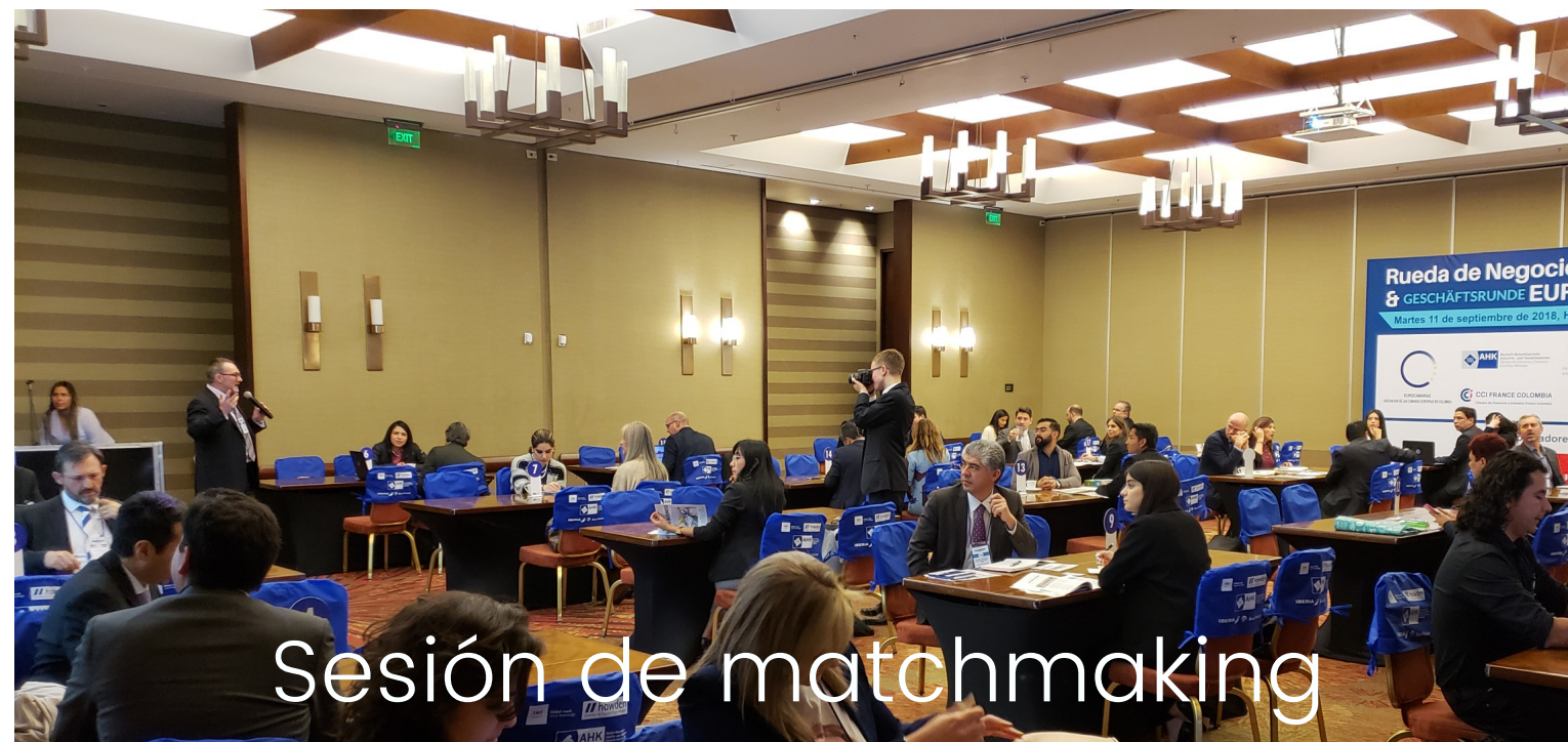
Sesión de matchmaking