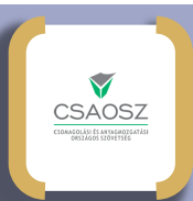
Association nationale pour l'emballage et la manutention