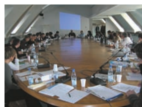
Réunion des auditeurs de la promotion « Jacques Delors » dans la Salle du Conseil d'administration de l'Ena, Strasbourg, mai 2008.