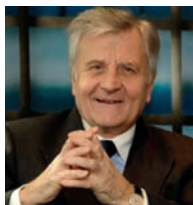
Jean-Claude TRICHET, parrain de la promotion 2012 (Copyright : Crédit Union européenne, 2011).