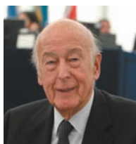
Valéry GISCARD D'ESTAING, parrain de la promotion 2009 (Copyright : Parlement européen - Unité Audiovisuel).