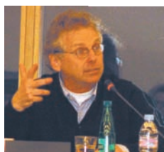
Daniel COHN-BENDIT, Député européen en débat au Parlement européen avec les auditeurs de la promotion « Valéry Giscard d'Estaing », Strasbourg, le 10 mars 2009.