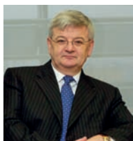
Joschka FISCHER, parrain de la promotion 2013.