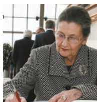
Simone VEIL, parraine de la promotion 2007 (Copyright : Parlement européen - Unité Audiovisuel).