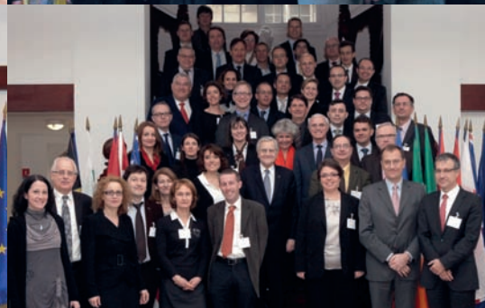
Promotion "Jean-Claude Juncker" à l'Ecole nationale d'administration, Paris, janvier 2012 (Copyright : ENA).

Vous êtes cadre de haut niveau dans une entreprise, haut fonctionnaire, élu, journaliste, syndicaliste, membre d'une institution internationale ou acteur de la société civile ;