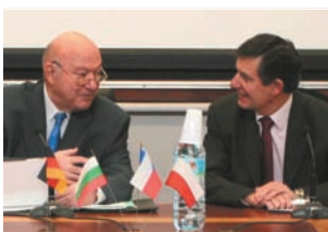
André SANTINI, Secrétaire d'Etat chargé de la fonction publique et Jean-Pierre JOUYET, Secrétaire d'Etat chargé des Affaires européennes à l'Ena, le 20 novembre 2007 pour la clôture du Cycle « Simone Veil ».