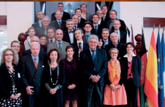
Promotion "Frédéric Mitterrand" à l'Ecole nationale d'administration, Paris, octobre 2010.