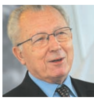
Jacques DELORS, parrain de la promotion 2008.