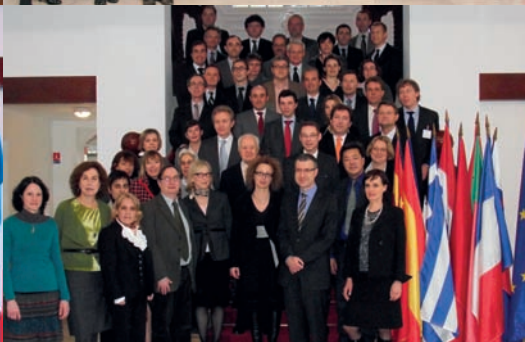
Promotion "Mário Soares" à l'Ecole nationale d'administration, Paris, novembre 2011.