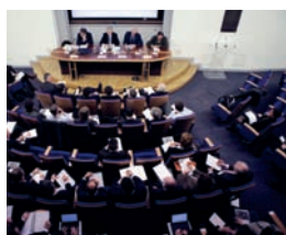
Ouverture de la session 2012 par le parrain de la promotion, Jean-Claude Trichet, l'Ecole nationale d'administration, Paris, janvier 2012 (Copyright : ENA).