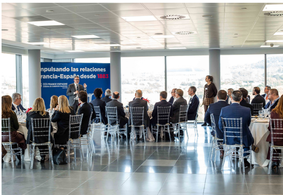
Más de 40 empresarios y empresarias asistieron al encuentro.