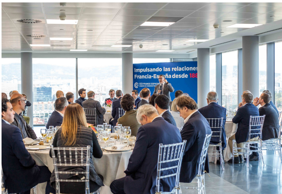
Ambiente durante el parlamento de Miquel Sàmpser.