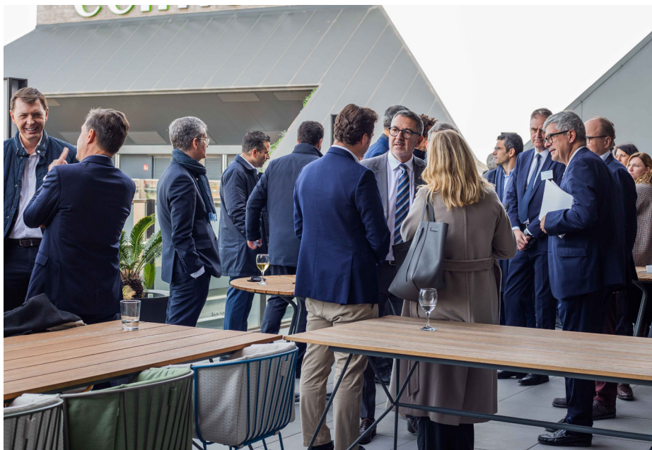
Ambiente de networking distendido en la terraza de la Torre Ponent.