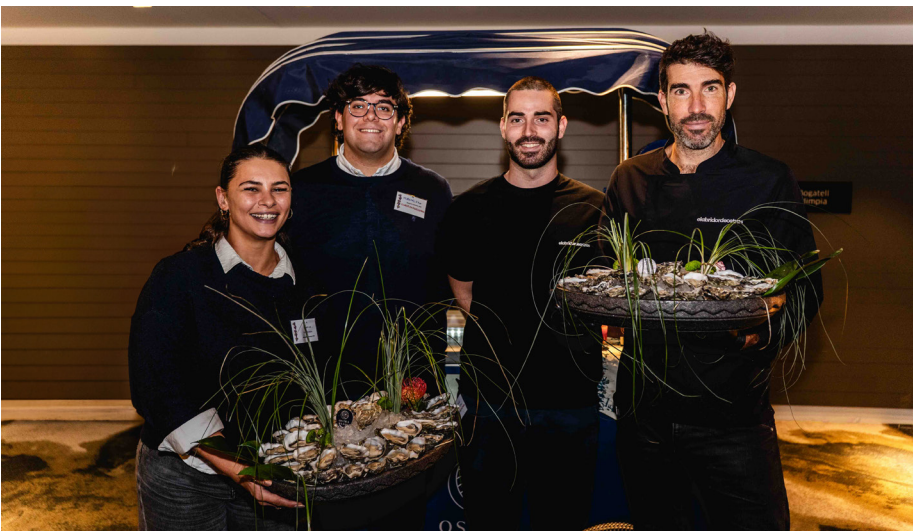
La Famille Boutrais (Ostra Regal)

Un año más volvimos a rendir homenaje a una de las tradiciones más emblemáticas del calendario francés con una nueva edición de la Fiesta del Beaujolais Nouveau , celebrada este año en el elegante entorno del Sofitel Barcelona Skipper .