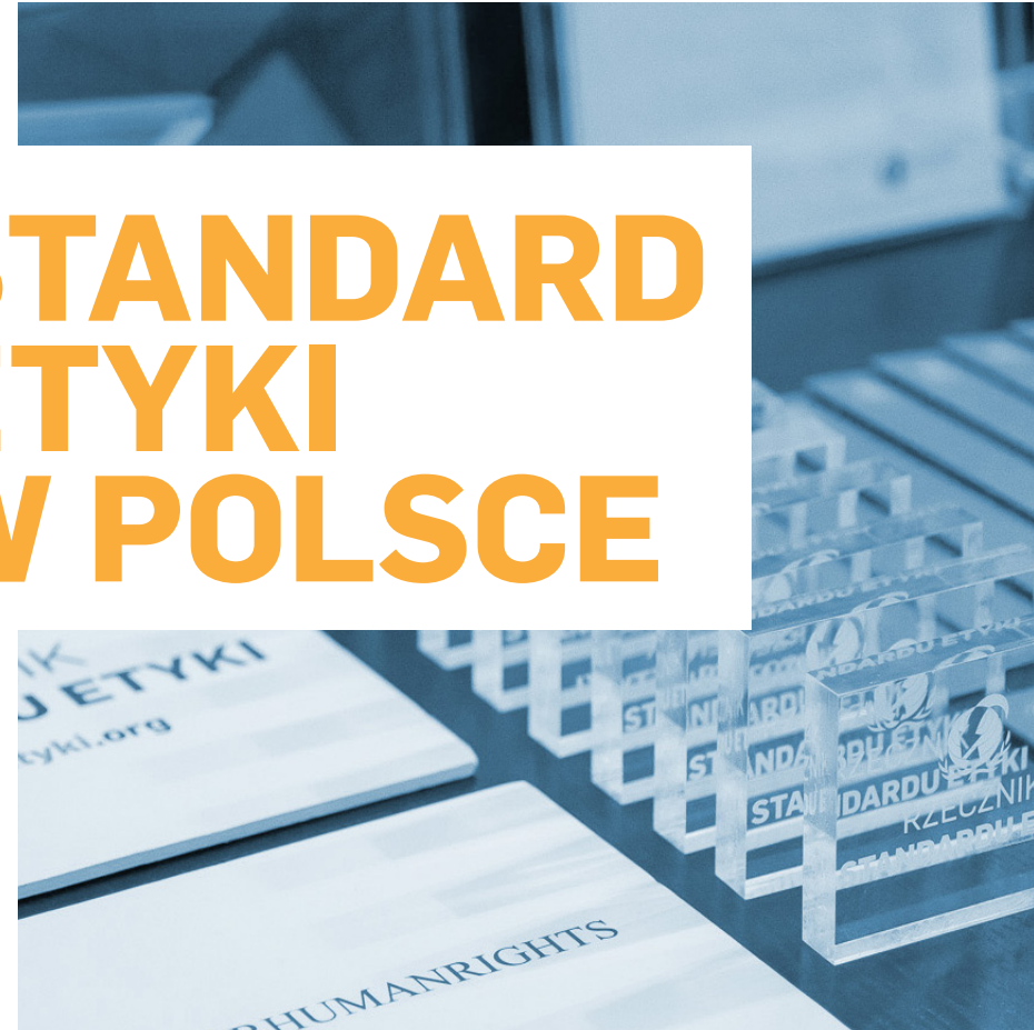
Przegląd Działań Programowych Global Compact Network Poland i Partnerów w 2019 r.