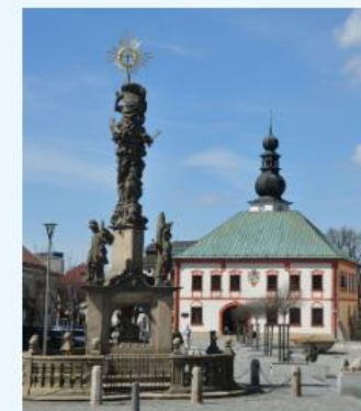
Žďár nad Sázavou