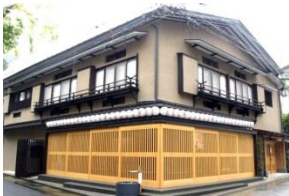
Hakone Kenban (Maison des geishas)

Pourquoi ne pas expérimenter la culture traditionnelle japonaise à Hakone?