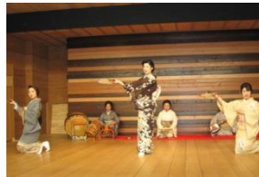
Performance des geishas