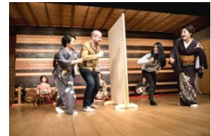
Jeux avec les geishas