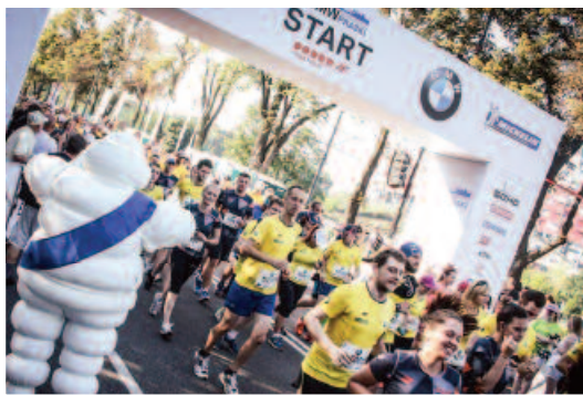
BMW Półmaraton Praski