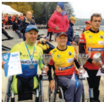
Integryjny Klub Sportowy „SMOK”