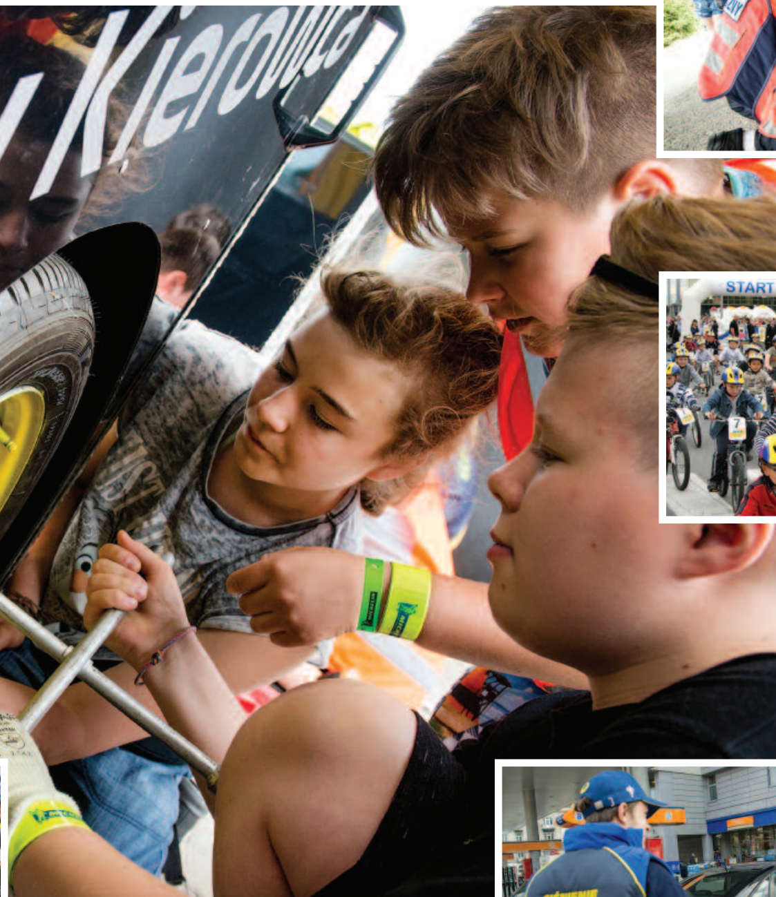
Klub Rowerowy Michelin Team (M-Team)