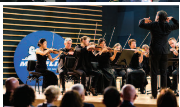
Koncert Orkiestry Symfonicznej z Owernii podczas występu w olsztyńskiej filharmonii