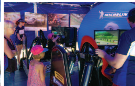
Panel edukacyjny dotyczący bezpiecznych zachowań na drodze podczas Nocy Naukowców