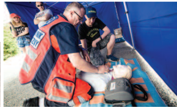
Pokazy pierwszej pomocy to nieodłączny element podczas rodzinnych pikników