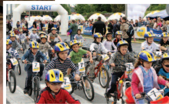
Michelin Junior Bike – wielki wyścig dla małych ludzi