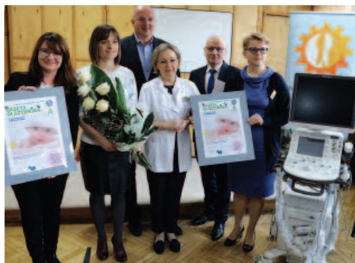
Przekazanie sprzętu medycznego Wojewódzkiemu Specjalistycznemu Szpitalowi Dziecięcemu w Olsztynie