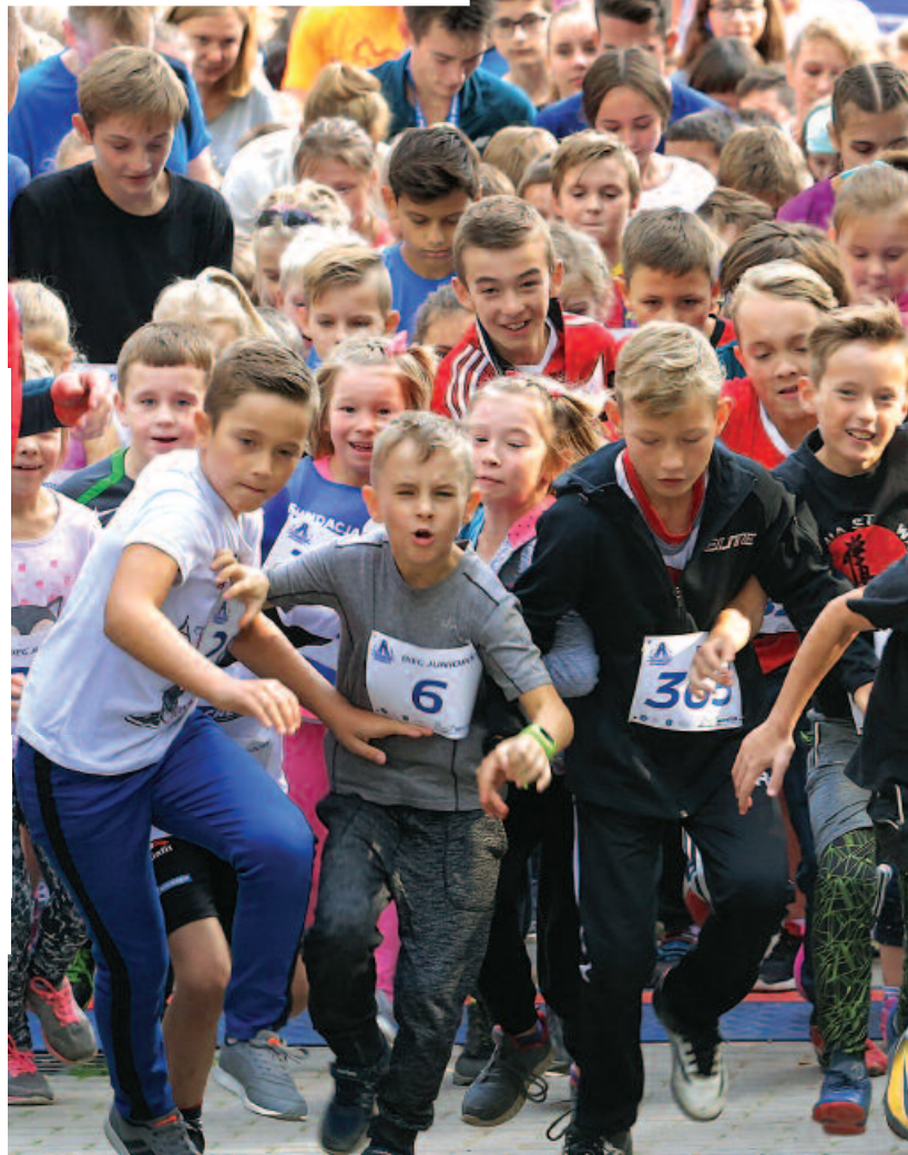
Kilometry Pomocy. Wybiegane i wyjeżdżone kilometry przez pracowników firmy i mieszkańców regionu przeliczone na złotówki wsparły olsztyńskie szpitale