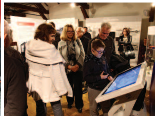
Wystawa w Muzeum Nowoczesności podczas obchodów jubileuszu firmy