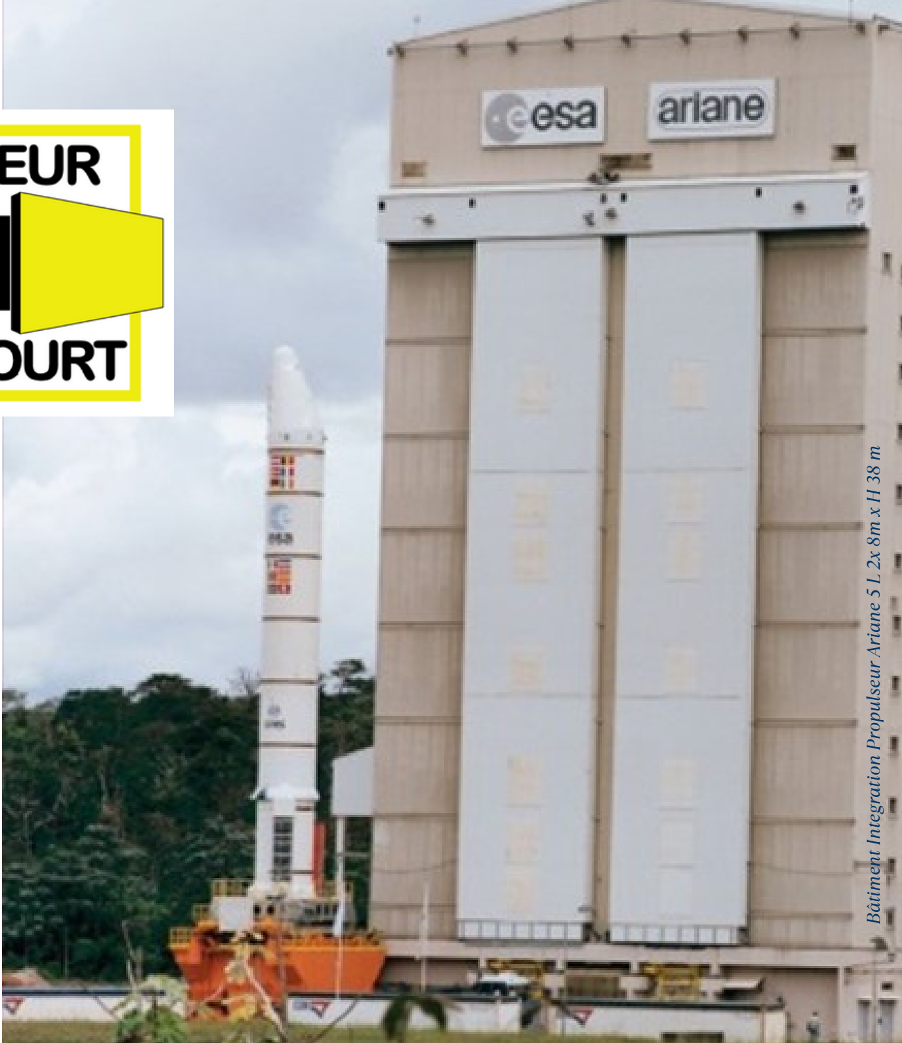
Bâtiment Intégration Propulseur Ariane 5 L 2x 8m x H 38 m