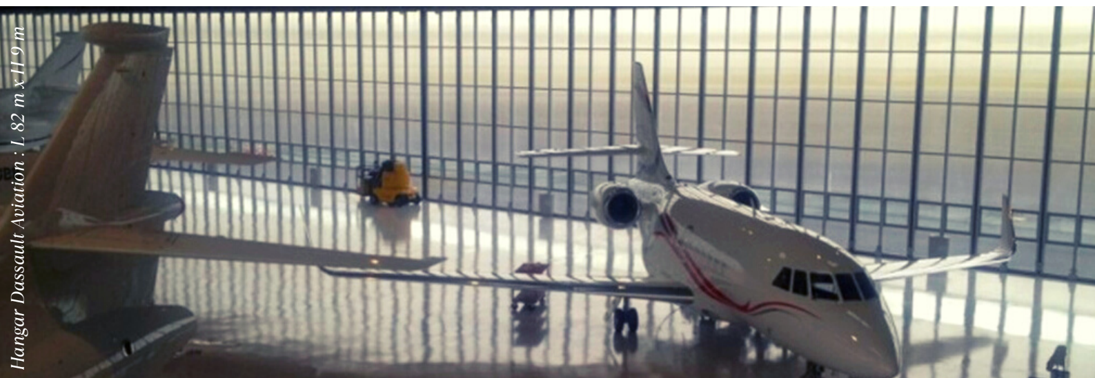
Hangar Dassault Aviation : L. 82 m x H 9 m

MINEUR BECOURT MIDDLE EAST LLC, EN TANT QUE FILIALE DE MINEUR BECOURT SYSTÈMES, HÉRITE DE L'EXPERTISE D'UNE ENTREPRISE CENTENAIRE DU NORD DE LA FRANCE, SPÉCIALISÉE DANS LA CONCEPTION DE SYSTÈMES DE FERMETURE DE HAUTE TECHNICITÉ. FONDÉE EN 1912 À VALENCIENNES, LA SOCIÉTÉ A OBTENU DES BREVETS ET QUALIFICATIONS, TÉMOIGNANT DE SON ENGAGEMENT ENVERS L'EXCELLENCE TECHNIQUE ET LA FIABILITÉ.