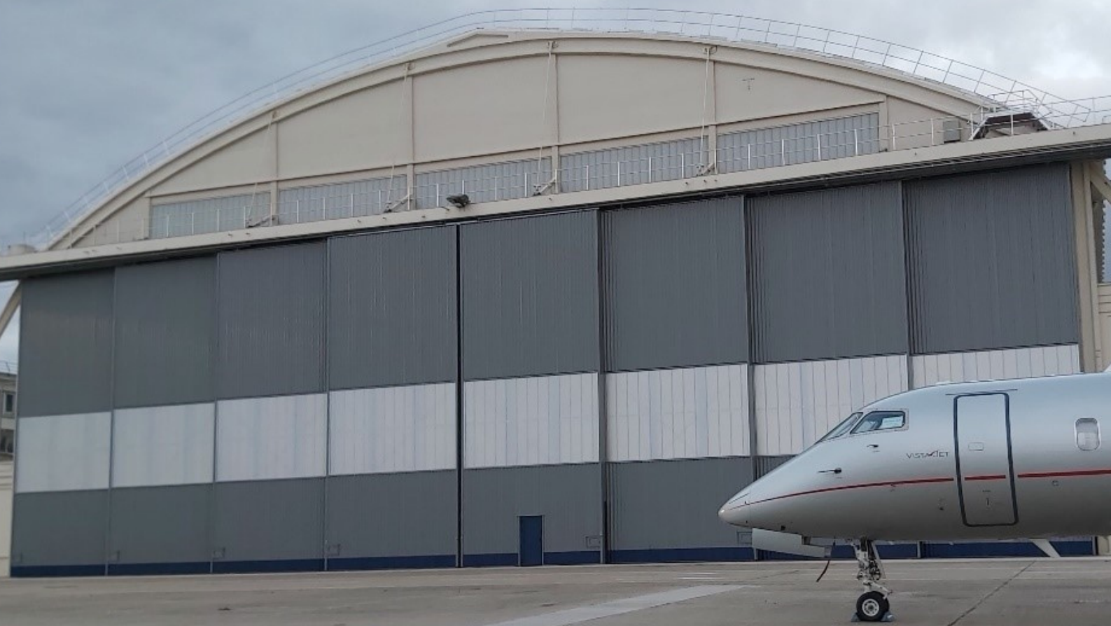
Hangar Lossier sur l'aéroport du Bourget : L 50 m x H 15 m .