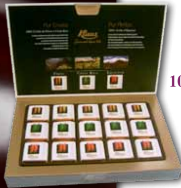
1051401 | Coffret de napolitains 72 % Pérou, Costa-Rica et Equateur Display of criollo napolitains PCB 12, Poids net 225 g