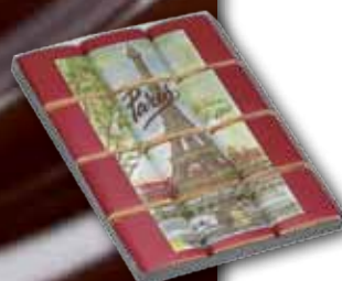
1076 | Étui Puzzle « Tour Eiffel » Etui Puzzle « Eiffel Tower » PCB 10, Poids net 176 g