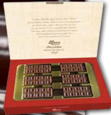
1022158 | Coffret mini-tablettes Mini bars filled PCB 12, Poids net 198 g