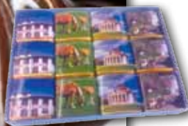
1052402 | Chocolats assortis « Puzzle de vues régionales » Assortment of chocolate « French vues »