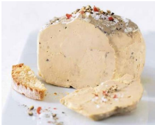
LE FOIE GRAS

VALORISER LE SAVOIR-FAIRE FRANÇAIS, EN S'APPUYANT SUR :