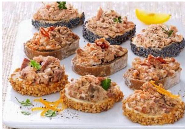
LES TERRINES ET RILLETES