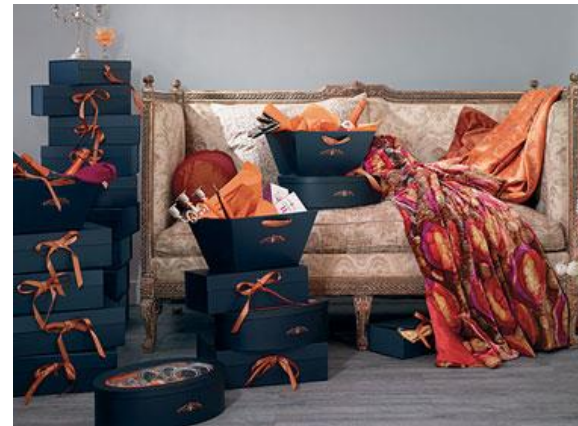
LES CADEAUX GASTRONOMIQUES