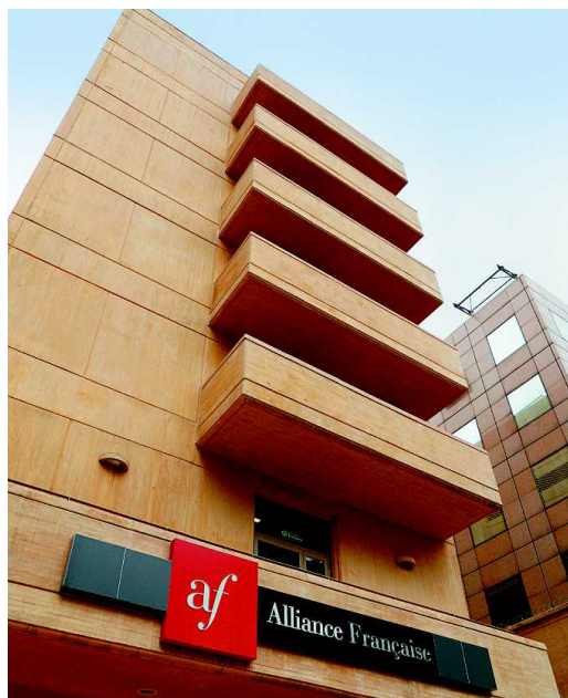
La sede de la Alianza Francesa en Bogotá se encuentra junto a la embajada.