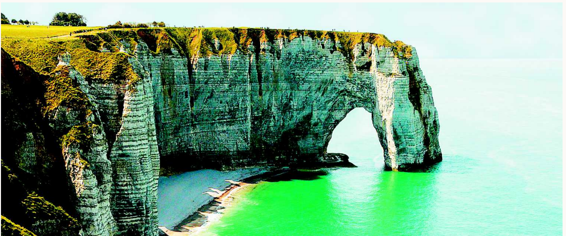
Normandía no solo es un paraje histórico, su belleza natural lo ha convertido en un concurrido atractivo turístico.

Para concretar sus proyectos de estudios en Francia, las personas interesadas pueden solicitar información en Campus France, que es la agencia gubernamental francesa encargada de promover la educación superior. Esta, a su vez, organiza charlas informativas semanales y brinda orientación personalizada (presencial o virtual) sobre los estudios en Francia. Para obtener más información, solicitar cita y descargar material, acceda a: www.colombia.campusfrance.org