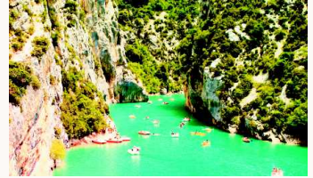
Los paisajes franceses son uno de los atractivos del país.