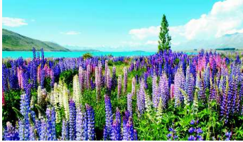
La lavanda se ha convertido en símbolo de La Provenza.

UNA MAGNÍFICA MUESTRA FOTOGRÁFICA DE LA ESTATUARIA AGUSTINIANA ENGANARÁ UN LUGAR EMBLEMÁTICO DE PARÍS, Y ACADÉMICOS COLOMBIANOS RENDIRÁN UN HOMENAJE A PAUL RIVET EN EL MUSEO DEL QUAI BRANLY.