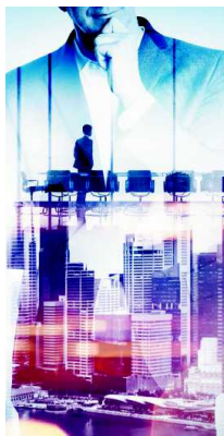
La CCIFC guía a emprendedores colombianos y franceses.

Del mismo modo, e independientemente de su actividad y tamaño, cada empresa afiliada puede encontrar una oferta personalizada. Esta entidad promueve además el Premio Orbe InnoVerde, un reconocimiento a las buenas prácticas ambientales. Finalmente, la CCIFC goza de respaldo internacional al hacer parte de la Red de Cámaras de Comercio e Industria Francesas, integrada por 115 entidades en 85 países, con más de 33.000 afiliados.