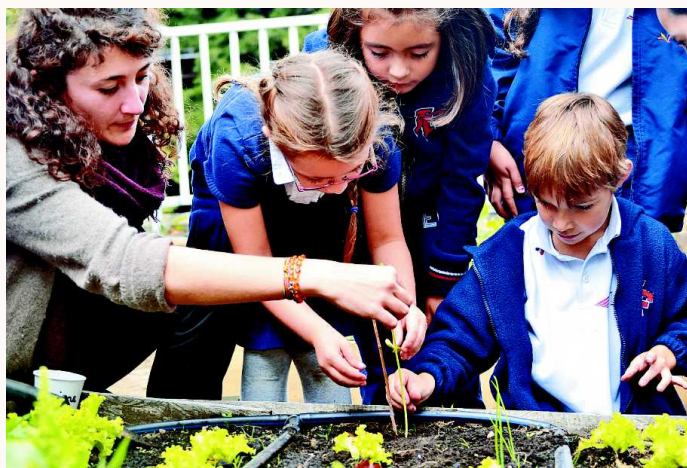
Siembra de matas y muros vegetales es una de las actividades con la que los estudiantes de los liceos franceses de Bogotá, Cali y Pereira buscan generar mayor conciencia ambiental.

EL MUSEO NACIONAL ACOGERÁ LA EXCEPCIONAL COLECCIÓN DE ARTE MEDIEVAL DEL MUSEO DE CLUNY DE PARÍS, DE ABRIL A JULIO DE 2017.