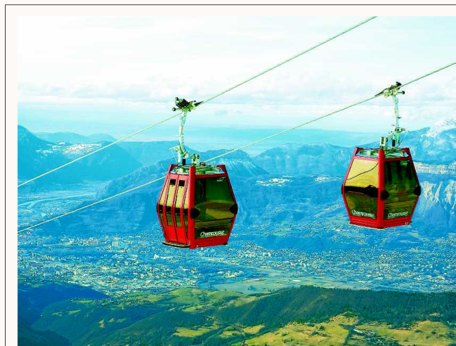
POMA llegó a Colombia en 2003, invitada por el Metro de Medellín, para construir el primer transporte por cable urbano articulado a un sistema masivo: el Metrocable de la capital antioqueña.

Por la excelencia de su educación superior. También está la relación calidad y precio de sus universidades: menos de 300 euros ($1 millón) al año para un máster que será reconocido en todo Europa.