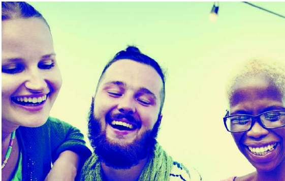
La Corporación Club Concorde fue fundada en 1998 por la Embajada de Francia y reúne a más de 5.000 socios.

LA FIESTA DE LAS LUCES DE LYON ILUMINARÁ LA PLAZA DE BOLÍVAR PARA LA APERTURA DEL AÑO FRANCIA-COLOMBIA, EN DICIEMBRE DE 2016.