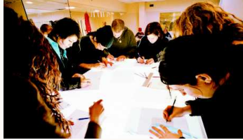
Francia tiene más de 200 programas de becas para estudiantes colombianos.