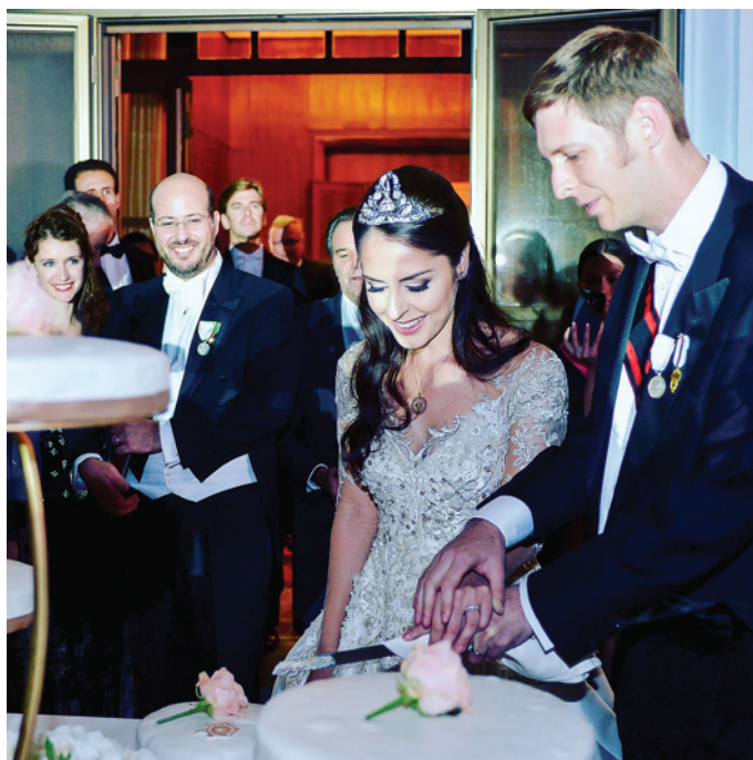
Sopra, il taglio della torta nunziale. In basso, l'apertura delle danze

Anche se oggi l'Albania è una Repubblica, si comprende bene che con questo matrimonio d'amore l'antica Casa Reale continuerà a lato delle autorità dello Stato un intenso lavoro per favorire la cultura e lo sviluppo economico del proprio Paese.