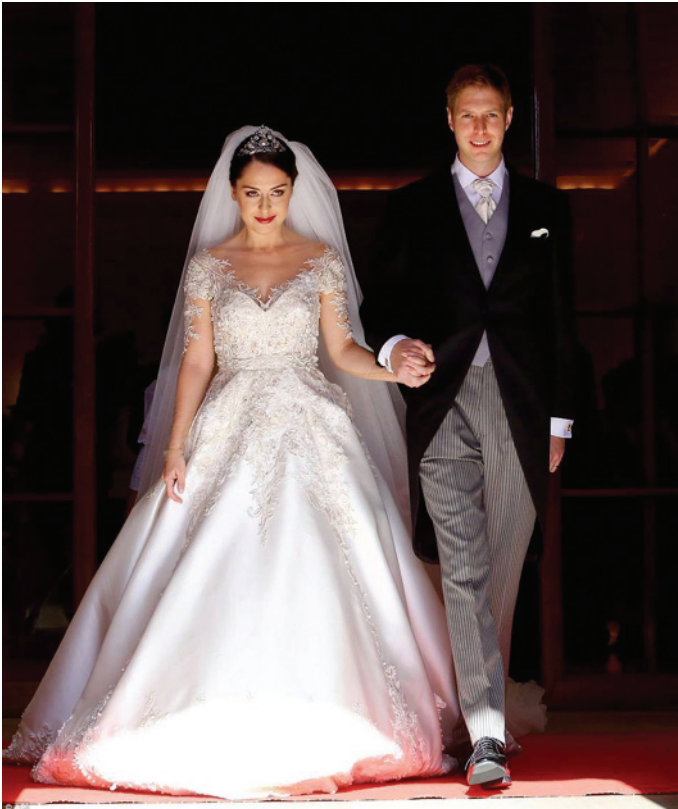
Sopra le LL.AA.RR. i principi ereditari Leka II ed Elia degli Albanesi, uscendo da Palazzo Reale. In basso, i testimoni e le damigelle d'onore con le LL.AA.RR. i principi ereditari degli Albanesi

(Sudafica) dichiarato temporaneamente per 24 ore dal governo sudafricano territorio albanese. Ha studiato