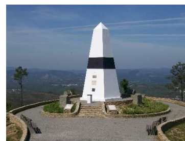
Centro Geodésico de Portugal

Limitado a norte pela ribeira da Isna, a sul pela ribeira do Codes e a oeste pelo Rio Zêzere, o concelho assume-se como uma península, o que lhe atribui características específicas bem expressas na paisagem. Caracteriza-se por um território bastante montanhoso, atingindo altitudes próximas dos 600 metros, como é o caso da Serra da Melriça, ex-libris concelhio por albergar o Picoto da Melriça – Centro Geodésico de Portugal.