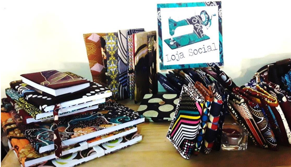
Customização de Cadernos, agendas & Porta documentos reciclados