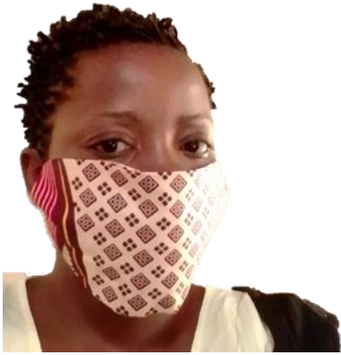
Máscara caseira tripla camada sem pregas