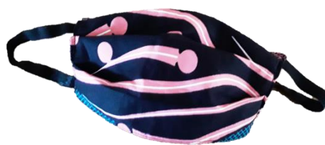
Máscara de proteção caseira tripla camada com pregas