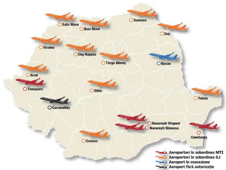
Figure 3 Les aéroports en Roumanie

De même, les aéroports de Suceava, Iași, Baia Mare et Târgu Mureș ont enregistré une croissance dans le nombre de passagers et de vols.