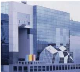
JR Kyoto Isetan

Initiative de la CCI France Japon, le projet Bonjour France est né de la volonté de donner au grand public japonais une image dynamique, actuelle et diversifiée de la France, non seulement à travers les « Semaines françaises », mais aussi à travers des événements culturels, gastronomiques et art de vivre. Chaque année, Bonjour France invite le public japonais à partager l'art de vivre « à la Française » et à découvrir des produits français inédits sur Isetan Shinjuku, Mitsukoshi Nihonbashi et Isetan Kyoto.