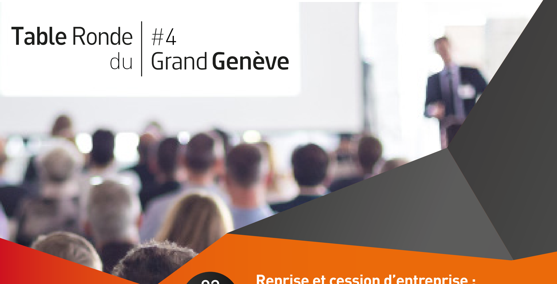
Table Ronde | #4 du Grand Genève